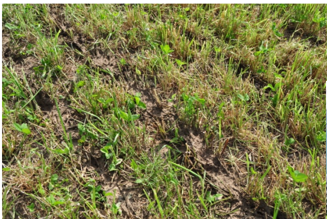
P. Aeby. IAG, 2010.