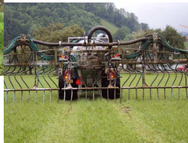
P. Aeby. IAG, 2010.