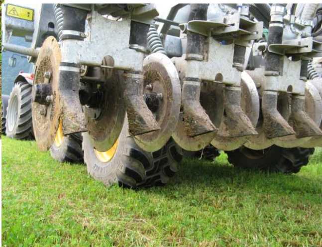
P. Aeby. IAG, 2010.