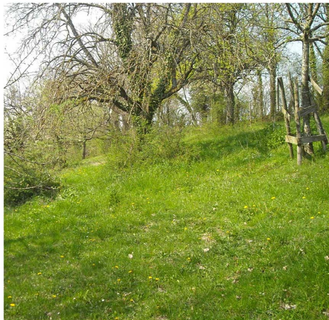
Pâturage extensif avec structures