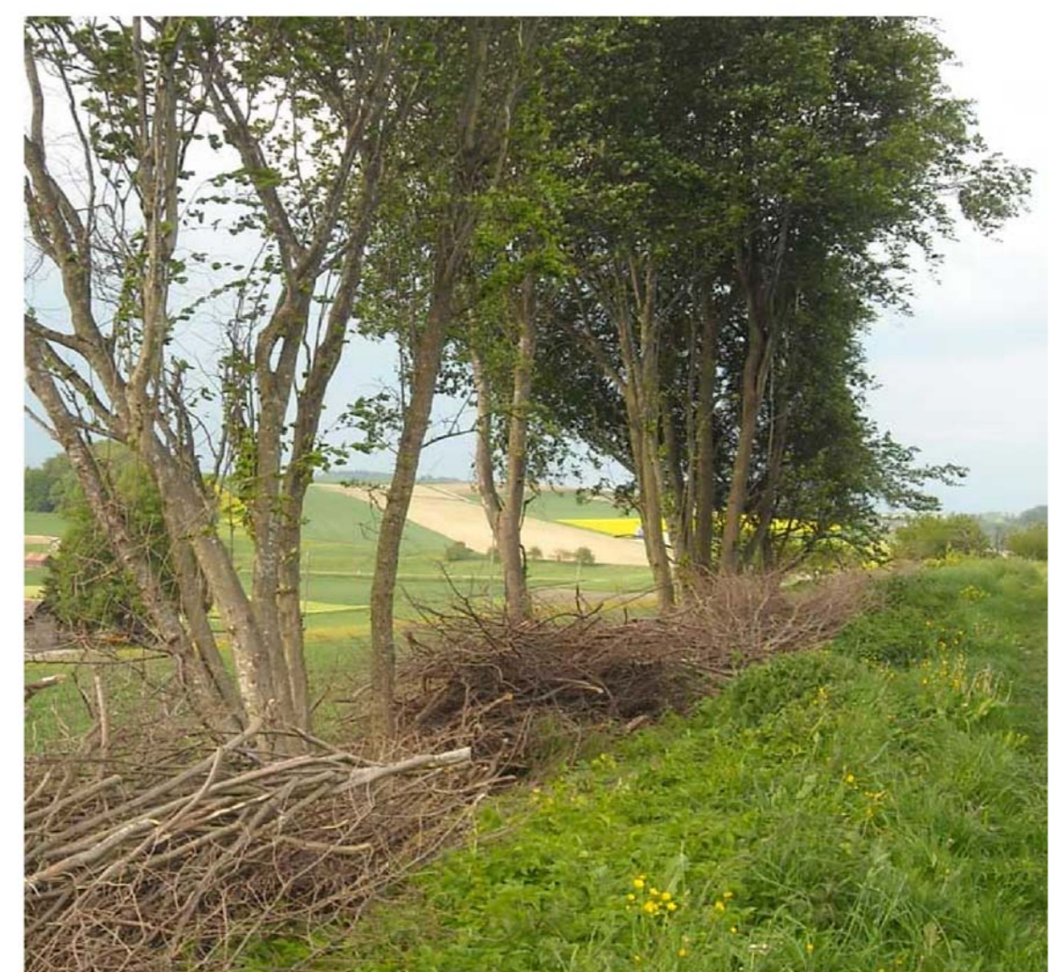
Haie en première année après l'entretien